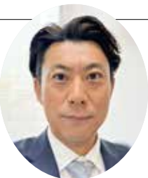
神奈川県司法書士会 総務部担当理事

A 司法書士が提示する相続登記の見積書は、司法書士報酬だけでなく国へ納める税金（登録免許税）等が入っています。したがって、ご質問のケースでは30万円が全て司法書士への報酬ではありません。これから司法書士へ依頼される方も、見積書をよく見ていただき、何が報酬で何が税金等かご確認ください。都市部では、半額以上が税金というケースもよくあつたりします。