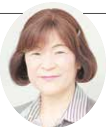
神奈川県司法書士会 企画部担当理事

A 亡くなられた方の名義のままでは、不動産を売却することはできません。不動産を売却する場合、売主と買主の間で売買契約を結びますが、亡くなられたお父様は売主になることができません。不動産を売却する前に、まずは相続登記をする必要があります。相続登記は令和6年4月1日より義務化となりますので、お早目に手続きを済ませましょう。司法書士は相続登記の専門家です。是非司法書士にご相談ください。