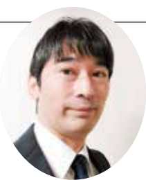
神奈川県司法書士会 研修部担当理事

A 遺産分割協議は、必ず相続人全員で行う必要があります。相続人の中に認知症等で判断能力のない方がいる場合、家庭裁判所に成年後見人を選任してもらいましょう。遺産分割協議は成年後見人との間で行うこととなります。なお、一度成年後見人が選任されると、相続手続終了後も成年後見人の職務は継続します。成年後見の制度や手続方法については、家庭裁判所が最寄りの司法書士にお問い合わせください。