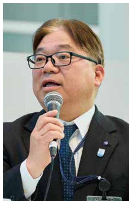
横浜市建築局 うざわ そうめい 鵜澤 聡明 局長

1983年に千葉地方法務局採用。その後 法務省民事局・保護局・大臣官房等を経 て、2019年大臣官房秘書課政策立案・ 情報管理室長、22年新潟地方法務局長を 歴任。23年から横浜地方法務局長とし て着任。